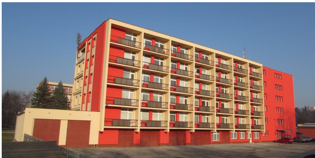
Obrázek 1 Areál Pionýrů

Zpráva byla zpracována na základě § 10 odst. 3 zákona č. 561/2004 Sb., o předškolním, základním, středním, vyšším odborném a jiném vzdělání (školský zákon), ve znění pozdějších předpisů, a na základě § 45 vyhlášky č. 2/2006 Sb., kterou se pro školy a školská zařízení zřizované Ministerstvem vnitra provádějí některá ustanovení školského zákona, ve znění pozdějších předpisů.