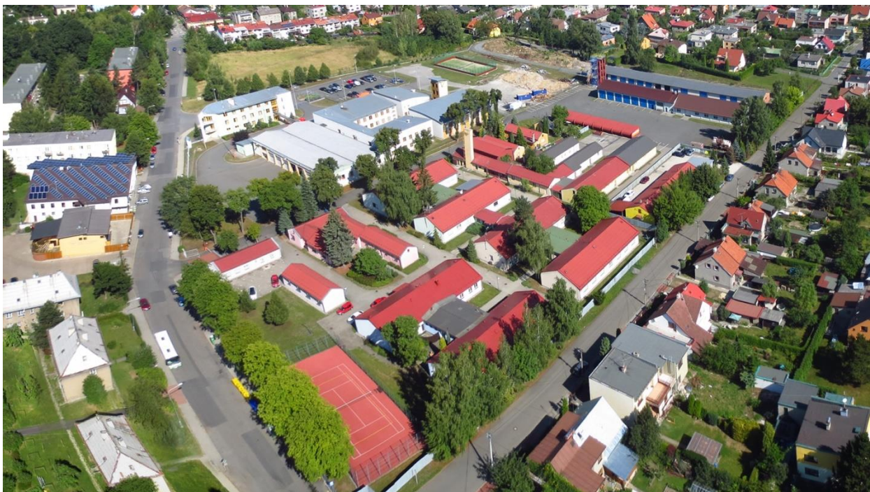
Obrázek 2 Areál Pavlíkova