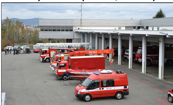
Den požární bezpečnosti, Česká Lípa