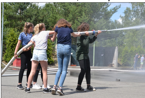
Den s hasiči, Česká Lípa