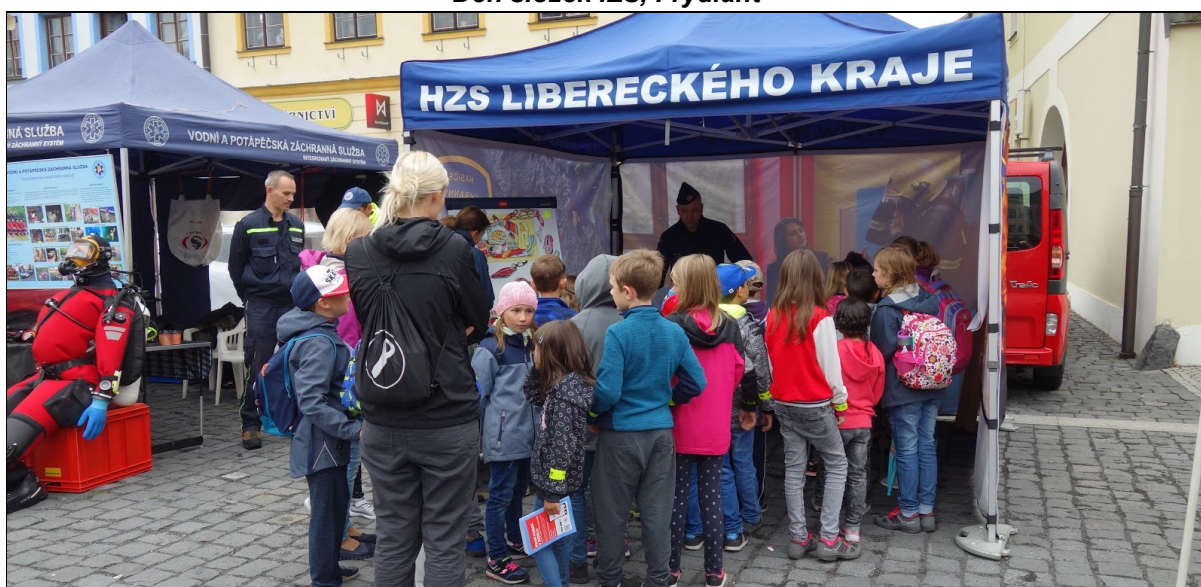
Den složek IZS, Frýdlant

Prohlídky centrálních požárních stanic a „Dny otevřených dveří“ využívají především všechny typy škol a pořádají se podle aktuálních požadavků a možností jednotlivých požárních stanic. Dny otevřených dveří se konaly na sedmi požárních stanicích HZS LK. Velkou skupinu, která navštívila stanice HZS LK, tvořili žáci druhých a šestých tříd základních škol zapojených do programu „Hasík CZ“. Prohlídky stanic byly pořádány nejen pro základní a mateřské školy, ale například i pro členy SDH a zahraniční návštěvy.