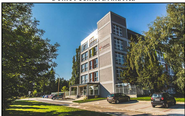
Domov seniorů Anavita