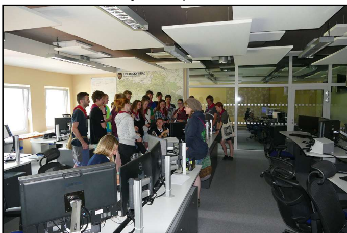
Prohlídka krajského operačního střediska