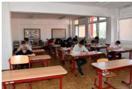
Obrázek č. 16: Příjímací řízení SOŠ PO