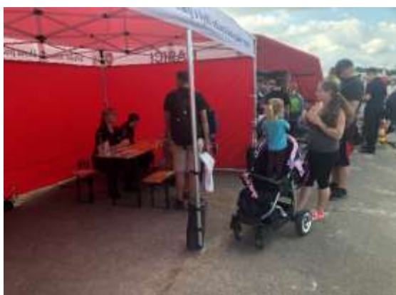
Obrázek č. 6: Dny NATO 2023

V rámci zvyšování povědomí veřejnosti o vzdělávacích aktivitách poskytovaných naší školou jsme se účastnili prezentačních akcí určených pro širokou veřejnost. V školním roce 2023/2024 to byl např. Veletrh vzdělávání a uplatnění ve Frýdku-Místku nebo Dny NATO 2023 v Ostravě.