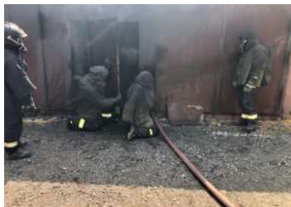
Obrázek č. 5: Řízená praxe