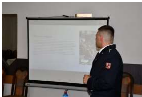
Obrázek č. 18: Absolutorium VOŠ