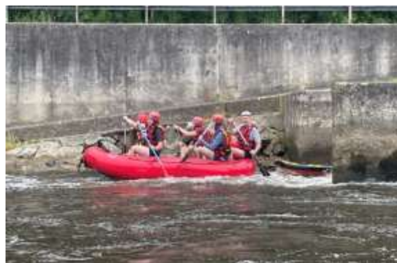
Obrázek č. 14: Sportovní kurz 1. ročníku SOŠ PO