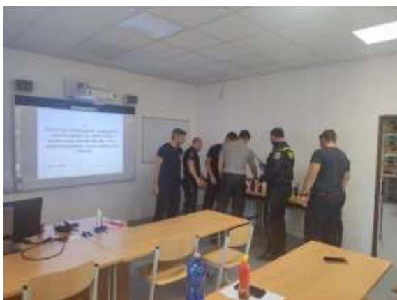
Obrázek č. 9: Řízená praxe