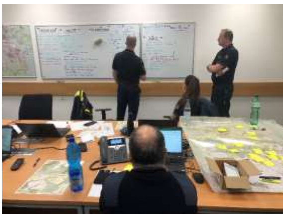
Obrázek č. 22: výcvik krizového štábu