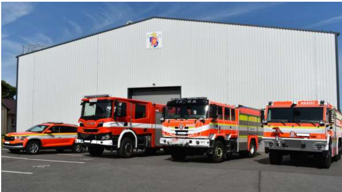
Obrázek č. 24: moderní požární technika SOŠ PO a VOŠ PO