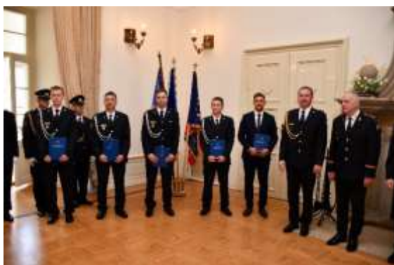
Obrázek č. 19: Slavnostní vyřazení VOŠ