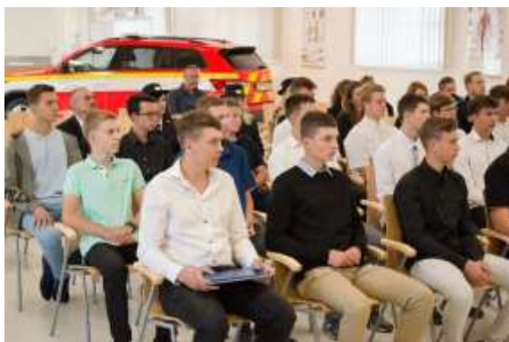
Obrázek č. 11: Slavnostní zahájení SOŠ PO

Učební plán tohoto studijního oboru vydalo Ministerstvo vnitra – generálního ředitelství Hasičského záchranného sboru České republiky po dohodě s Ministerstvem školství, mládeže a tělovýchovy České republiky dne 30. 12. 1993 pod č. j. PO-3257/III-93 s účinností od 1. 1. 1994, počínaje 1. ročníkem. Poslední zápis do rejstříku škol a školských zařízení byl proveden dne 23. 4. 2013 s účinností od 1. 9. 2013, rozhodnutí bylo vydáno pod č. j. MSMT-16879/2013. Učební dokumenty jsou aktualizovány v souladu s rámcovým vzdělávacím programem a metodickými materiály, které vydává Ministerstvo vnitra – generální ředitelství Hasičského záchranného sboru České republiky. Do 1. ročníku SOŠ PO bylo na základě přijímacího řízení přijato 30 žáků, kteří nastoupili k 1. 9. 2023. Ve školním roce 2023/2024 proběhla ve dnech 12. a 15. 4. přijímací zkouška pro další ročník SOŠ PO. Ke studiu pro školní rok 2024/2025 bylo přijato 30 žáků.