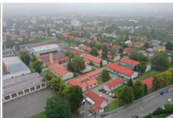
Obrázek č. 2: Areál Pavlíkova