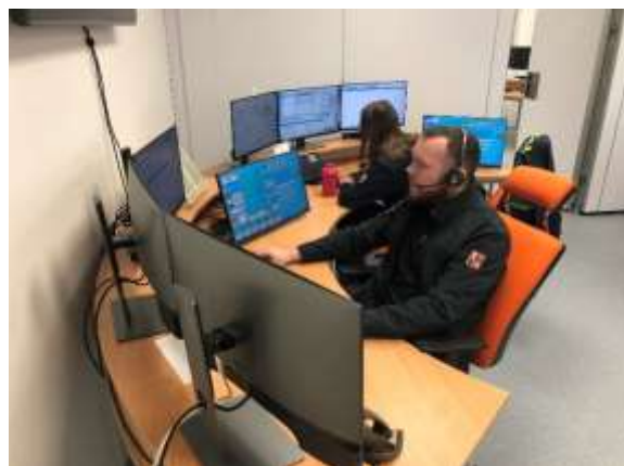
Obrázek č. 23: výcvik operátorů TCTV 112