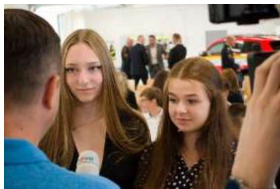
Obrázek č. 12: Slavnostní zahájení SOŠ PO