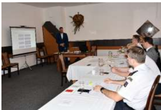
Obrázek č. 17: Absolutorium VOŠ

Studium VOŠ ve školním roce 2023/2024 probíhalo na základě akreditace schválené Rozhodnutím akreditační komise č. j. MŠMT-31770/2018-3 212 ze dne 18. 12. 2018, kdy byla schválena změna vzdělávacího program Prevence rizik a záchranářství a platnost akreditace vzdělávacího programu pro vyšší odborné studium byla prodloužena do 31. 8. 2025.