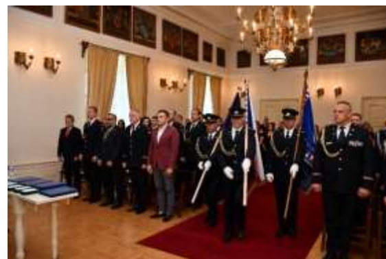
Obrázek č. 20: Slavnostní vyřazení VOŠ