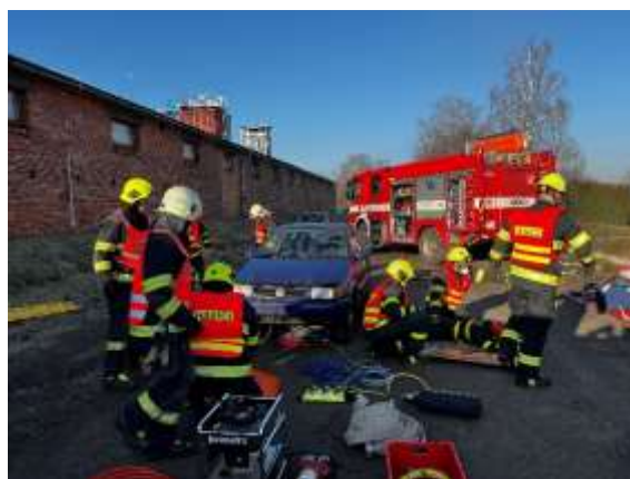
Obrázek č. 10: Řízená praxe

Pro dosažení co nejvyšší úrovně našich služeb se neustále snažíme o prohloubení odbornosti našich vyučujících a jejich plnou aprobovanost. Vytváříme podmínky pro jejich další vzdělávání a odborný růst formou účasti na instrukčně metodických zaměstnáních, na odborných seminářích a konferencích, zajišťováním odborných exkurzí, studiem pro naplnění požadavků zákona o pedagogických pracovnících č. 563/2004 Sb., a také realizací pravidelných stáží u jednotlivých HZS krajů, na MV-GŘ HZS ČR a u Zdravotnické záchranné služby Moravskoslezského kraje.