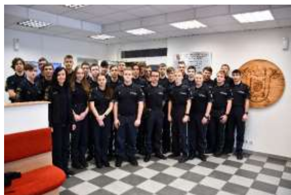
Obrázek č. 13: Žáci 1. ročníku SOŠ PO