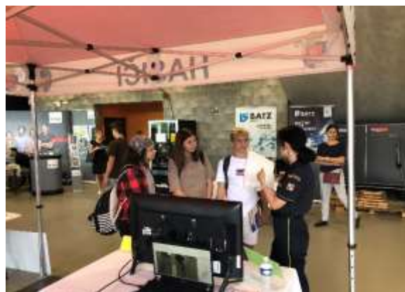
Obrázek č. 7: Veletrh vzdělávání a uplatnění F-M

Důležitou součástí je nepřetržitá spolupráce a koordinace aktivit školy s Ministerstvem vnitra – generálním ředitelstvím Hasičského záchranného sboru České republiky (dále také „MV-GŘ HZS ČR“). Prostřednictvím pravidelných porad pak projednává vedení školy se všemi příslušníky i občanskými zaměstnanci činnost a záměry možného rozvoje.