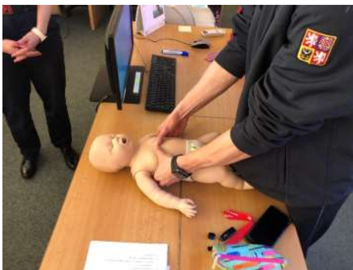
Obrázek č. 21: zdravotní příprava operátorů linky 112

Vzdělávací programy a kurzy odborné způsobilosti slouží k naplnění požadavků na odbornou způsobilost pro příslušníky HZS ČR podle § 72 zákona č. 133/1985 Sb. Jsou to jak kurzy k získání odborné způsobilosti, tak i kurzy k prodloužení odborné způsobilosti. Jedná se zejména o kurzy Nástupní odborný výcvik, Základní odborná příprava, Požární prevence, Ochrana obyvatelstva a krizové řízení, kurz Taktického řízení, Operačního řízení a kurz Takticko-strategického řízení a kurzy Jazykové přípravy operátorů linky 112. Osnovy těchto kurzů jsou k dispozici na webových stránkách Ministerstva vnitra – generálního ředitelství Hasičského záchranného sboru České republiky nebo na webových stránkách školy. Celkem se jedná o 16 typů kurzů. Kurzy k prodloužení platnosti se konají e-learningovou formou.