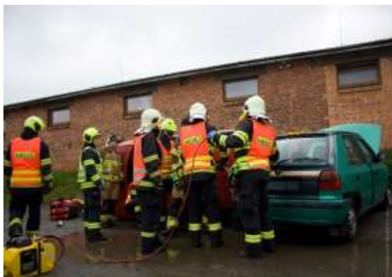
Obrázek č. 4: Řízená praxe

Nedílnou součástí v odborné způsobilosti zaměstnanců hasičských záchranných sborů podniků a členů sborů dobrovolných hasičů obcí a podniků je řízená praxe kurzů Nositel dýchací techniky a Nebezpečné látky. Naše škola zajišťuje teoretickou a praktickou přípravu u těchto kurzů, a nejen v těchto oblastech podporuje pravidelné vzdělávání zaměstnanců a členů jednotek PO a složek IZS. Kurz Nebezpečné látky se ve školním roce 2023/2024 neuskutečnil.