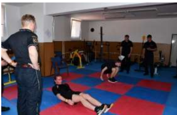
Obrázek č. 15: Příjímací řízení SOŠ PO