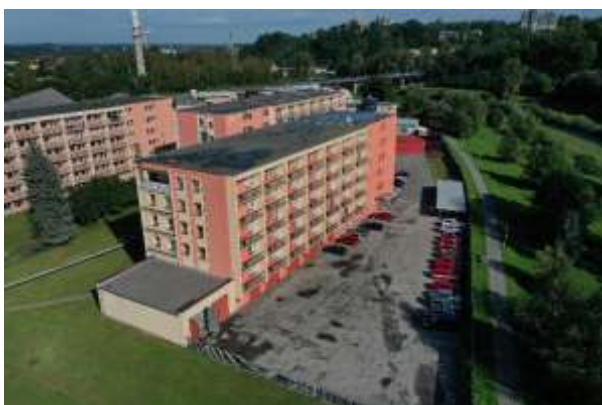
Obrázek č. 1: Areál Pionýrů

Zpráva byla zpracována na základě § 10 odst. 3 zákona č. 561/2004 Sb., o předškolním, základním, středním, vyšším odborném a jiném vzdělání (školský zákon), ve znění pozdějších předpisů, a na základě § 45 vyhlášky č. 2/2006 Sb., kterou se pro školy a školská zařízení zřizované Ministerstvem vnitra provádějí některá ustanovení školského zákona, ve znění pozdějších předpisů.